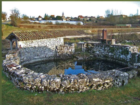
Petite sompe (Escamps) GPS : 44°22'01"N / 01°37'42"E