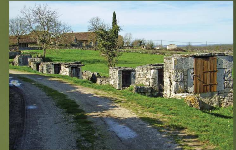
GPS : 44°23'08" N / 01°32'37" E