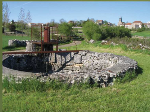
Grande sompe (Escamps) GPS : 44°21'55"N / 01°37'51"E