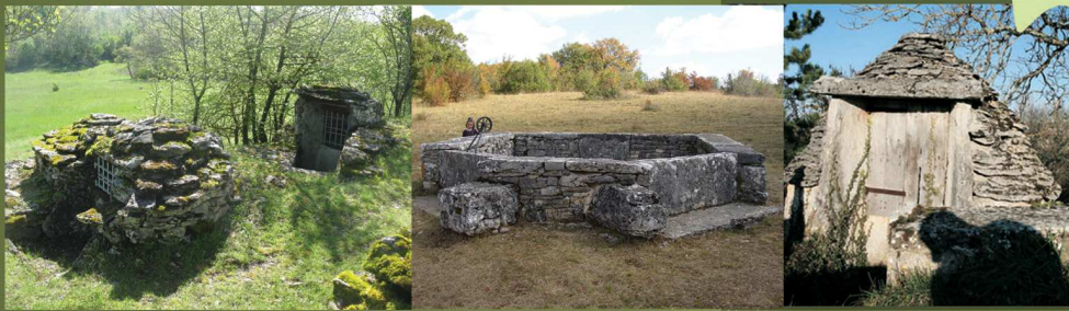
Chemin des Puits (Lugagnac) GPS : 44°24'53"N / 01°45'02"E Puits « romain » (Bach) 44°20'36"N / 01°41'01"E Puits caselle (Concots)

L'eau est rare en surface dans le pays, toutefois on y trouve des puits permettant d'accéder à des nappes d'eau situées à diverses profondeurs. Le plus souvent, il s'agit de petites constructions carrées ou rondes, parfois des caselles, munies d'un toit en lauzes et fermées d'une porte en bois. On trouve aussi des puits au fond de dolines ou cloup . C'est le cas des sompes d'Escamps. Parfois, la nappe, plus profonde (entre 10 et 20 m), est située dans une zone de calcaire altéré. Le puits dit « romain » d'Escabasse à Bach fait partie de cette catégorie. Enfin, certains sont en fait de simples citernes creusées dans la roche, comme à Bach à côté du puits « romain ».