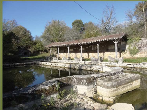
Lavoirs (Saillac) GPS : 44°19'51" N / 01°45'41" E