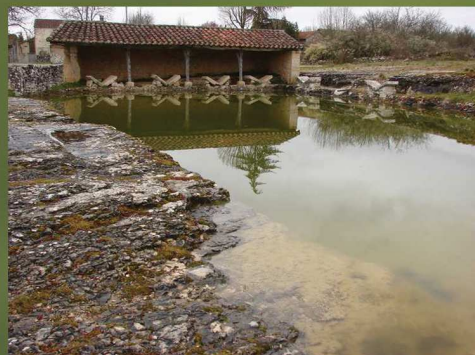
Lavoirs d'Escabasse (Bach) GPS : 44°20'38" N / 01°41'04" E