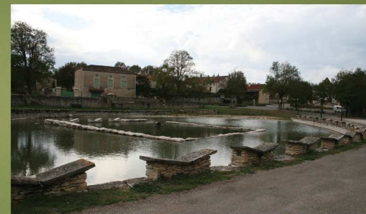
GPS : 44°22'31" N / 01°32'55" E