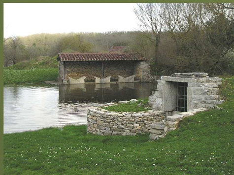
Lavoirs de Jamblusse (Saillac) GPS : 44°19'16" N / 01°43'19" E