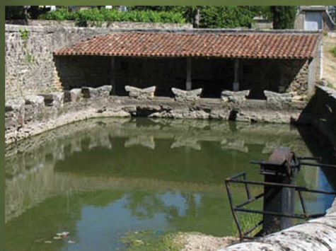
Lavoirs (Varaire) GPS : 44°21'28" N / 01°43'28" E